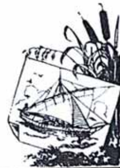
Bild 4: Haupttitel der ersten Auflage des Buches von Anton Schulzen aus dem Jahre 1904