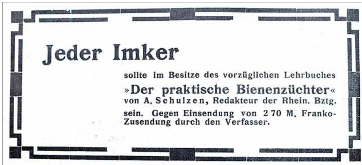
Bild 5: Anzeige für das Buch von Schulzen in der Rheinischen Bienenzeitung aus dem Jahre 1916 8

Dieses Buch mit 313 Seiten und 200 Abbildungen war so erfolgreich, dass immer wieder neue Auflagen notwendig wurden. Es erschien in Alpen-Millingen im Verlag Th. Gödden. Selbst heute noch finden die Ausführungen von Anton Schulzen Beachtung. Ein Reprint seines Buches erschien kürzlich im Jahre 2010. Die Formulierung im Untertitel des Buches "gewinnbringende Bienenzucht" gibt auch einen Hinweis auf die Einkommensverhältnisse eines Volksschullehrers in der damaligen Zeit. Die Lehrer waren äußerst schlecht bezahlt. Und deshalb nimmt es nicht wunder, dass in den einzelnen Bienenzuchtvereinen eine Vielzahl von Lehrern auftaucht, die sich über den Verkauf des gewonnenen Honigs ein kleines Zubrot verdienen. 7